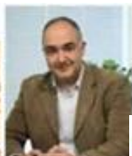
جناب آقای زوبین علاقه بند مدیر عامل اسنپ